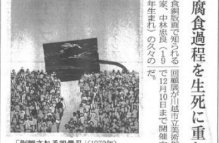
「別離される風景Ⅱ」(1972年)